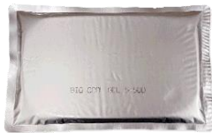
バイオクールジェル 5-500