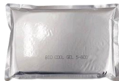
バイオクールジェル 5-800