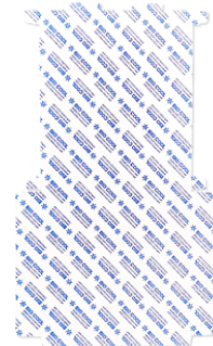
45用ジェルボックス 側面用