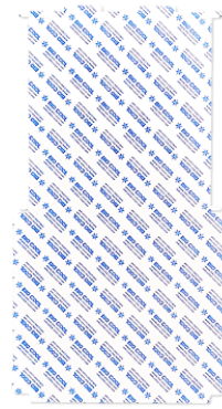
45用ジェルボックス 天地用